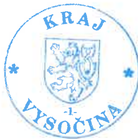
Miloš Vystrčil hejtman kraje