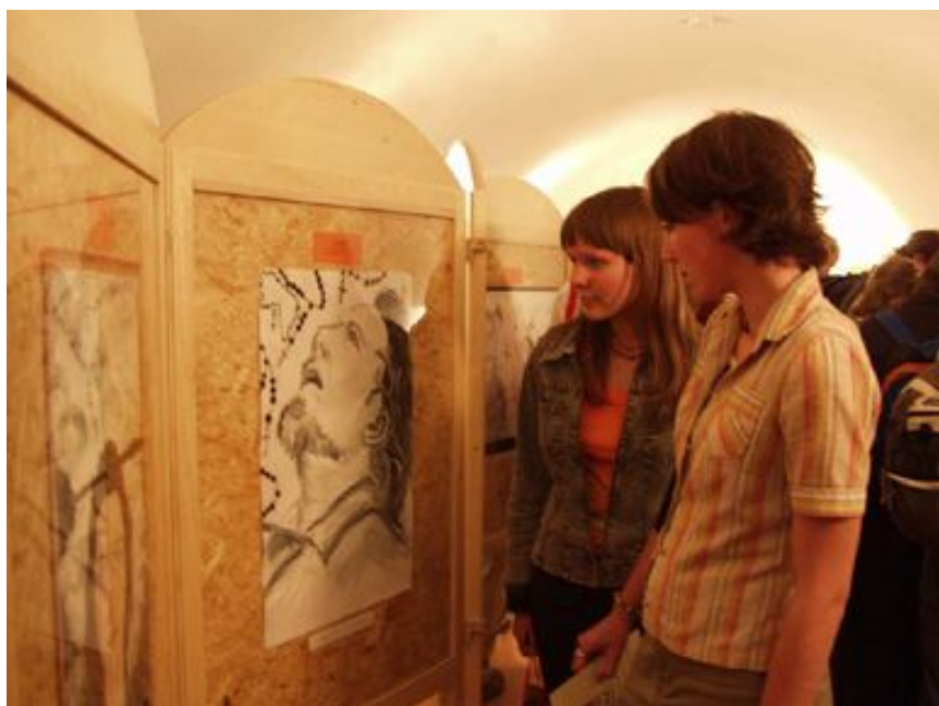
Ze slavnostního zahájení výstavy