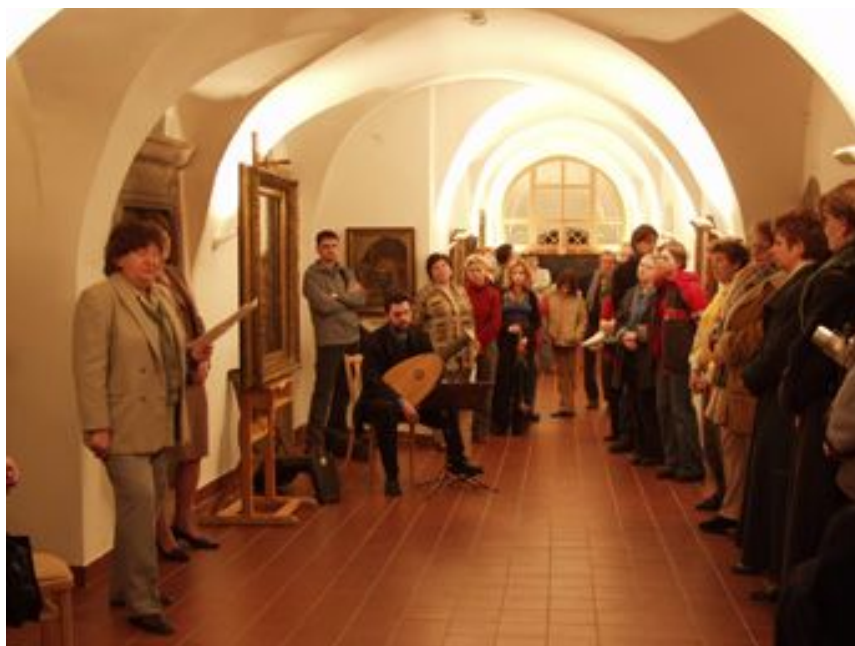
Ze slavnostního zahájení výstavy

Reprezentativní soubor obrazů představil základní umělecké směry, trendy a témata, jež jsou pro českou malířskou tvorbu 19. století typická /období preromantismu, romantismu, realismu, symbolismu až do 20. století, které ohlašuje nástup secese/. Výstava v rámci galerijních prostor představila v přízemí tvorbu žánrovou, sestavenou chronologicky a ukončenou generací Národního divadla; v přízemním sále tvorbu portrétní a zátiší a v sále 1. patra pak krajinomalbu převážně žáků Haushoferovy školy. Ze zvučných jmen zde byly svými obrazy zastoupeni Antonín Machek, Karel Purkyně, Jaroslav Čermák, Václav Brožík, otec, strýc a bratři Mánesové, v krajinomalbě nechyběl Josef Navrátil, Adolf Kosárek, Julius Mařák, Antonín Waldhauser, či Antonín Chittussi. Nedostalo se bohužel na témata historická (převážně z důvodů jejich velikosti), proto je tu zastoupily obrazy s vlasteneckou tematikou od Františka Ženíška či Mikoláše Alše. Nástup nového umění a nové doby pak prezentoval jemný portrét od Alfonse Muchy.