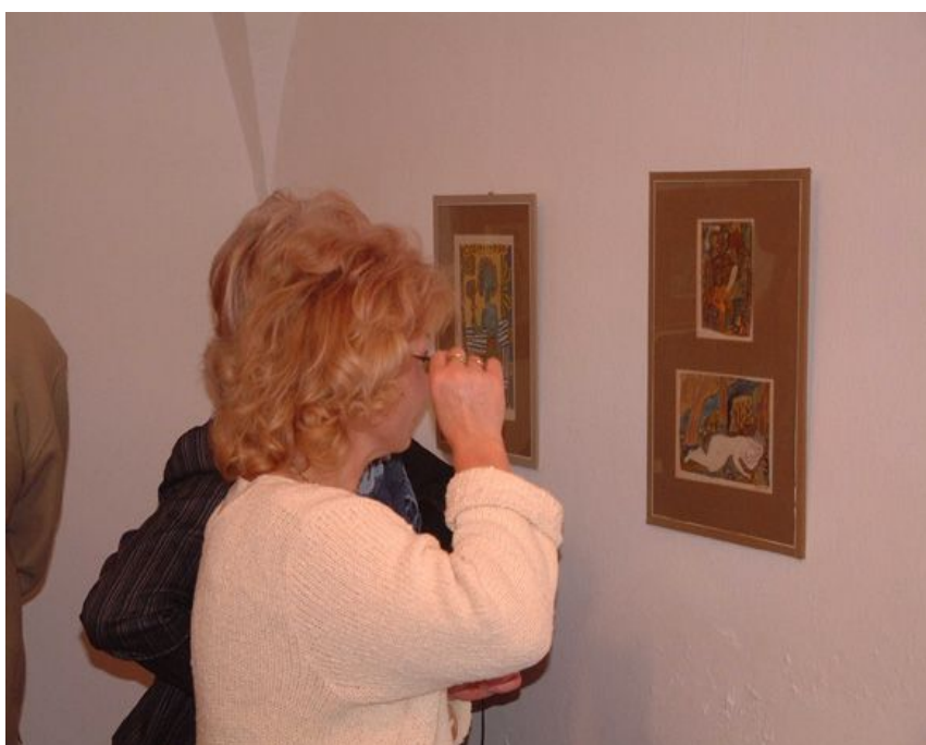
Ze slavnostního zahájení výstavy

Nejen pro generaci šedesátých let a milovníky divadla Semafor jsme připravili výstavu kreseb Jiřího Šlitra nazvanou dle vybraných motivů Hudba a ženy. Výstava představila Šlitra tak, jak ho málokdo zná, jako vynikajícího malíře a kreslíře. Ve dvou velkých tematických celcích shlédli návštěvníci různé podoby ženy včetně aktů, sál prvního patra byl pak věnován autorovu výtvarnému podání hudby, hudebníků a zákulisí divadla Semafor. Zvolená témata autora provázela celým životem.