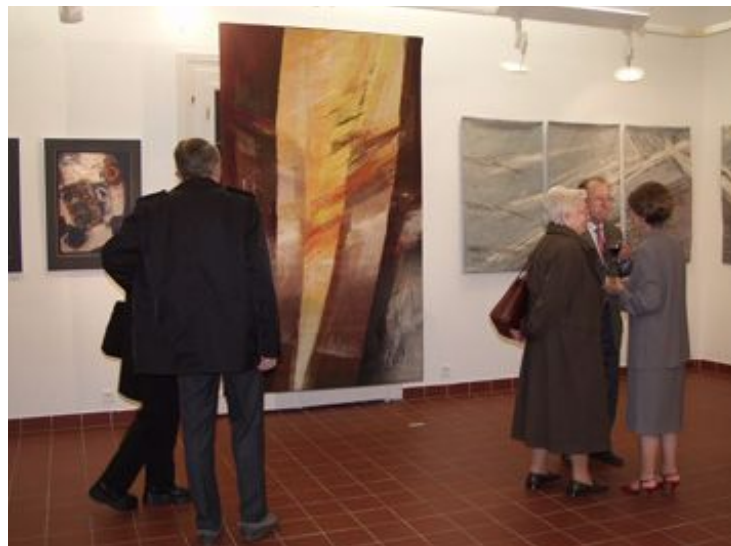
Ze slavnostního zahájení výstavy