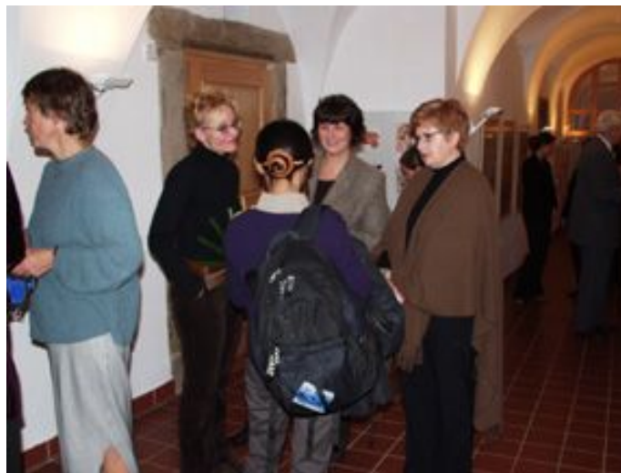
Ze slavnostního zahájení výstavy