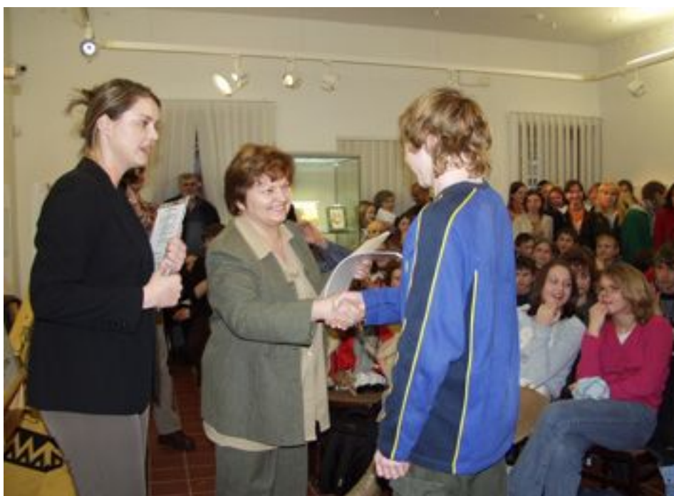
Ze slavnostního předávání ocenění

Soutěže vznikly na základě potřeby představení galerie jako kulturně vzdělávací instituce, kde je umění představováno netradičními a novými výchovnými metodami. Vzhledem k tomu, že komiksy jsou aktuální mezi mládeží, přivedly soutěže s touto tematikou tuto cílovou skupinu jim blízkou formou do galerie.