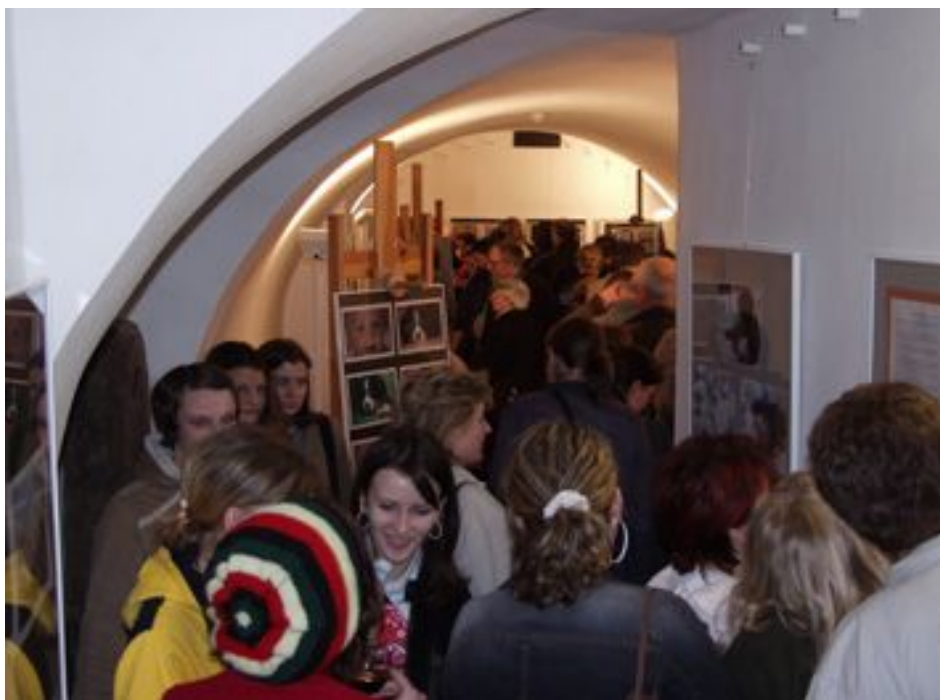
Ze slavnostního zahájení výstavy