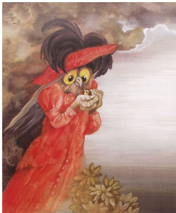
Eva Frantová – ilustrace ke knize Pohádky bratří Grimmů